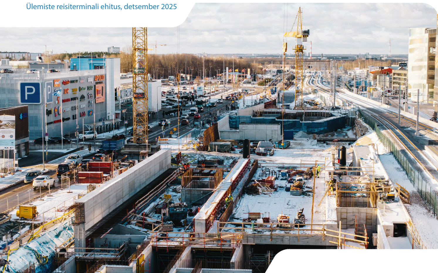
Ülemiste reisiterminali ehitus, detsember 2025

Tootsi-Pärnu lõigus sõlmiti koostöös Transpordiametiga neli projekteerimise lepingut viaduktide (Tootsi, Paide mnt raudteeviadukt, Murru, Timmermanni) ja ökoduktide (Elbi ja Sanga) projekteerimiseks ning üks projekteerimise ja ehitusleping Raeküla jalg- ja jalgrattatee tunneli rajamiseks.