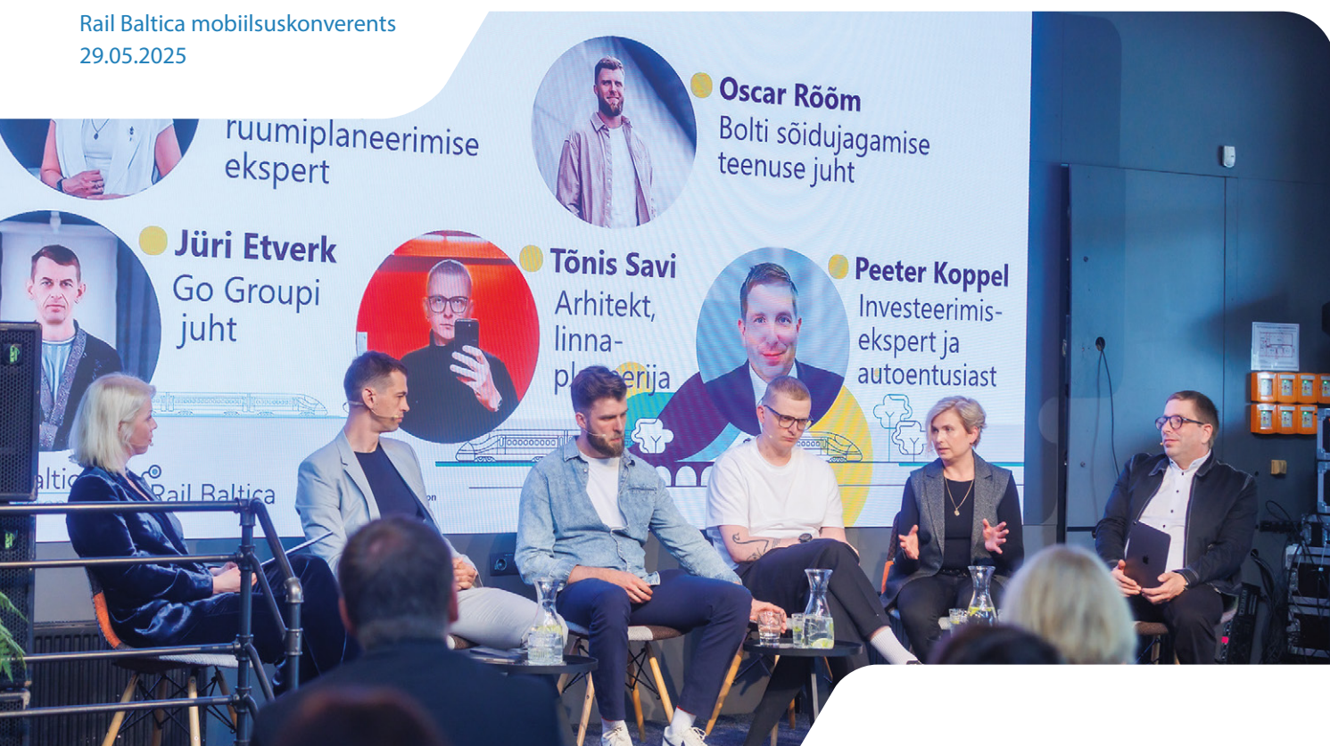
Rail Baltica mobiilsuskonverents 29.05.2025

1. juunil osales Rail Baltic Estonia Tallinna Loomaia lastekaitsepäeva programmis.